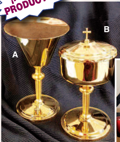
Bañado en oro de 24KT • Hecho en los EE. UU.