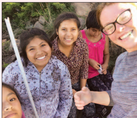
En una excursión al aire libre con las niñas.