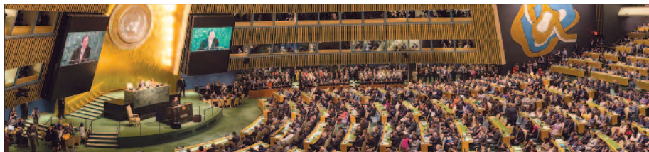
La sala de la Asamblea General de las Naciones Unidas en Nueva York.