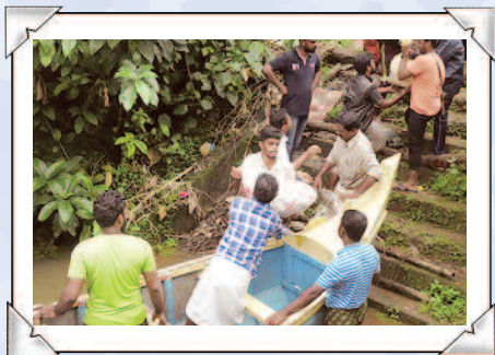
Voluntarios usan un bote para llevar suministros a los afectados por las inundaciones.

Al mirar hacia el futuro, los salesianos se proponen a dirigir proyectos sostenibles de reconstrucción a largo plazo, incluso en los ámbitos de ingeniería de reparación de viviendas y de sistemas de saneamiento, un proyecto cuyo costo se estima en casi $7 millones de dólares. A pesar de esta cifra significativa, los salesianos mantienen un firme compromiso a su misión. ♥