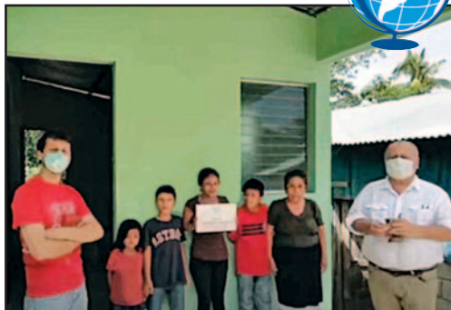
Una familia en el día en que recibieron su nueva casa.

El P. de Nardi también observó la alegría y el orgullo entre todos los beneficiarios del programa. Muchos inmediatamente plantaron flores en los patios de sus casas, algo que no habían hecho en sus albergues anteriores. «Ellos reconocen que la nueva casa es un regalo hermoso que se debe adornar con flores. Es una señal de que sus vidas han cambiado».