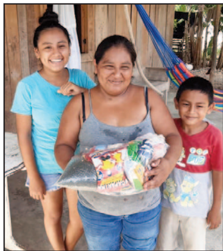
Los misioneros salesianos también proporcionaron paquetes de comida para familias necesitadas.

Los misioneros también proporcionaron asistencia alimentaria de forma continua a más de 100 familias vulnerables en la parroquia. Financiada por Misiones Salesianas y en colaboración con otras organizaciones humanitarias, la iniciativa permitió a los misioneros recaudar y distribuir paquetes de comestibles a quienes más lo necesitaban durante un período de cuatro meses.