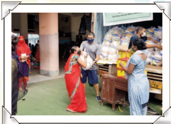
Los residentes recibieron botiquines de primeros auxilios y artículos de limpieza.

se realizará en las provincias de Maharashtra y Gurajat. El programa ha sido financiado por la oficina salesiana «Don Bosco Mondo» en Bonn, Alemania. En la actualidad, alrededor de 20,000 niños empobrecidos y sus familias en la India reciben comida, artículos de limpieza y botiquines de higiene personal.