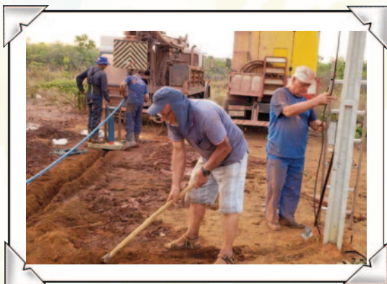
Los nuevos pozos durante la etapa de construcción.