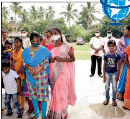
Muchos de los residentes atendieron la consagración de la nueva capilla.

India tiene la cuarta economía más grande del mundo, pero más del 22 por