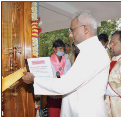
El sacerdote de la parroquia y los habitantes acuden a la ceremonia de inauguración.