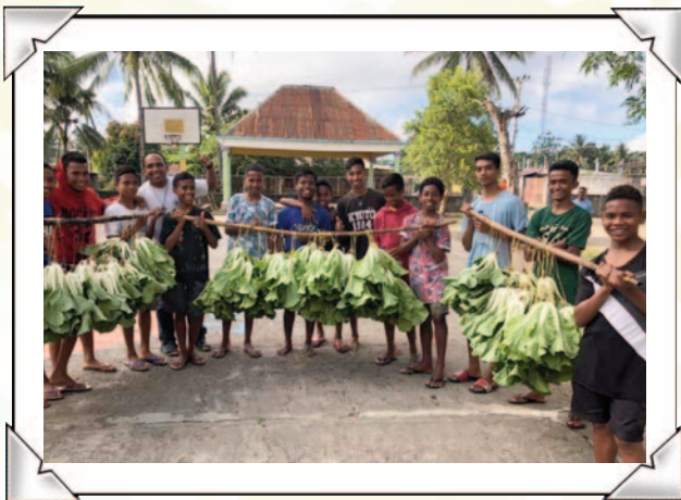
Los habitantes de Lospalos muestran sus cosechas.