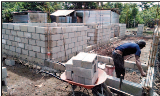
Las nuevas casas durante la etapa de construcción.

A principios del verano pasado, cuando las restricciones relacionadas al covid-19 llegaron a San Benito Petén, Guatemala, muchas de las familias que ya enfrentaban desafíos se vieron aún más afectadas. Por ende, de acuerdo con todas las precauciones de seguridad, nuestros misioneros salesianos emprendieron iniciativas para ayudar a los más necesitados del municipio.